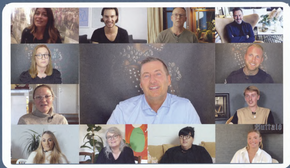
Lyngemetoden rådgiver hver uge hundredevis af borgere, online på zoom

Lyngemetoden giver borgerne de konkrete løsninger, der skal til for at mindske deres problemer.